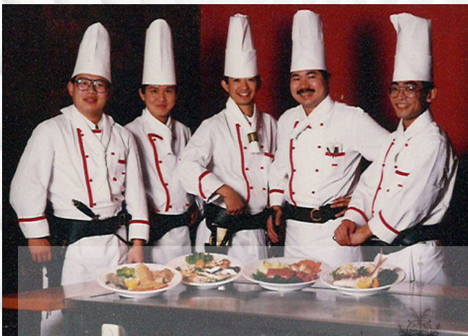
Die Anfangsjahre das Kabuki-Team der Pionierzeit

Er freut sich darauf, Sie persönlich mit einem herzlichen „Willkommen zurück“ begrüßen zu dürfen.